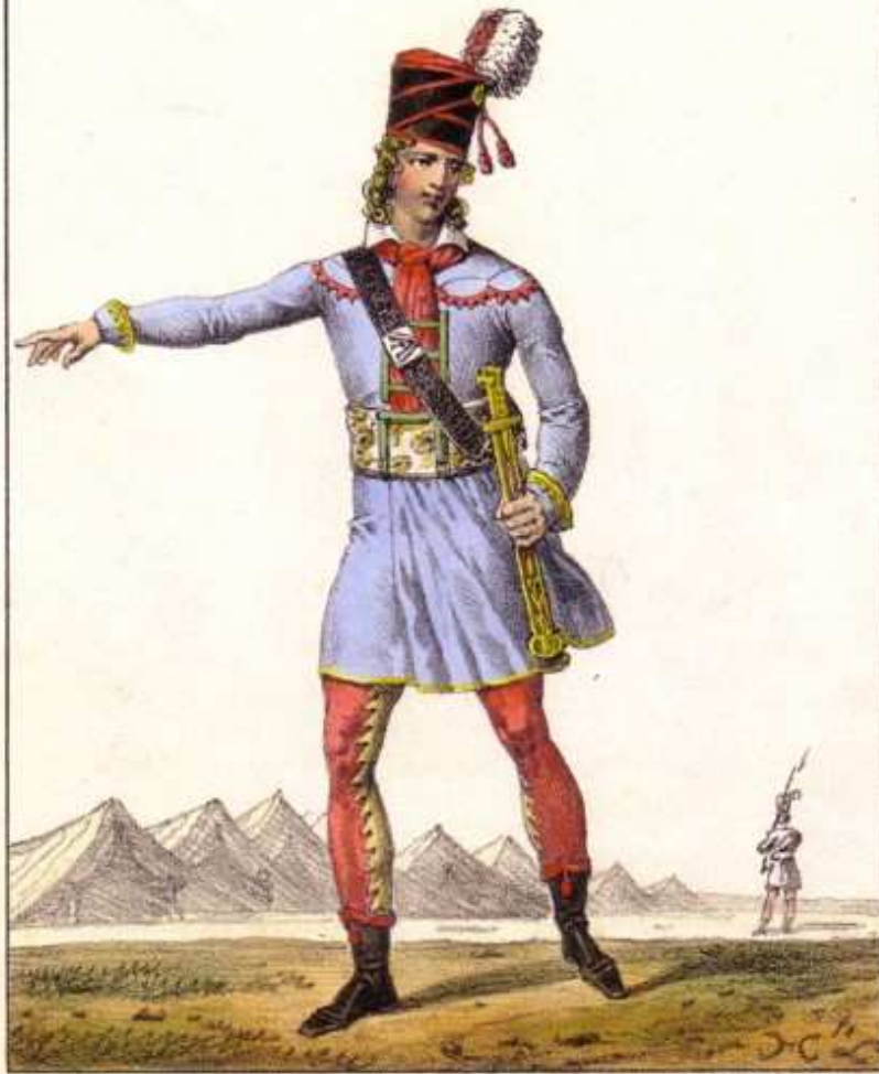
Cloue du camp de Mars. 1793.